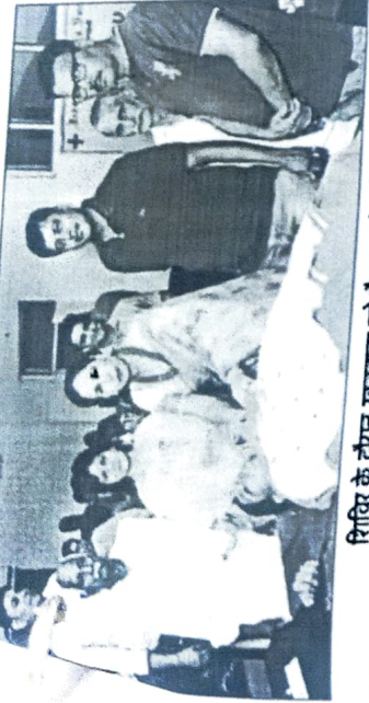
शिबिर के दौरान रक्तदाता को बैंड लगाते प्रतिधि